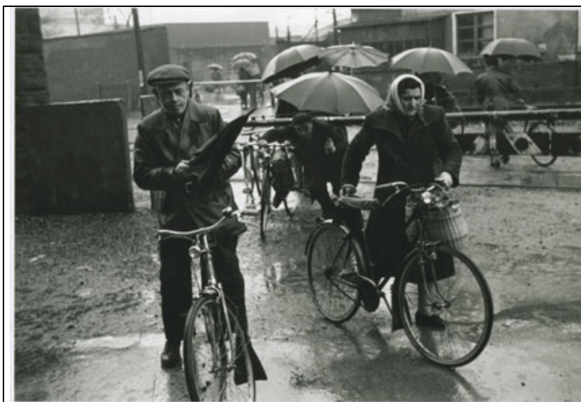
Sesto San Giovanni, anni '60. Il passaggio a livello sulla ferrovia della Breda che collegava la Breda acciaieria IV a via del Riccio